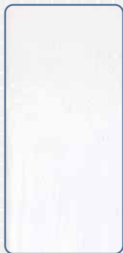
ノンブリードタイプの シーリング材