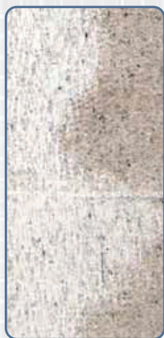
一般的な シーリング材

一般的なシーリング材では、塗装の種類によって、塗膜への汚染や、密着不良が発生することがありますが、ノンブリードタイプのシーリング材では、汚染性・密着性とも良好な結果が得られております。