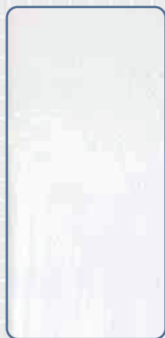
ノンブリードタイプの シーリング材